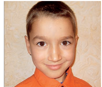
Паша, 8 лет – Я считаю самым известным человеком Васю. Это мой друг, мы с ним давно знакомы и мне он известен. А еще всем известен Дима Билан, он поет и рекламирует духи.

Рита, 6 лет – Пушкин, потому что он написал «Три девицы под окном...». У меня есть такая книжка. А из живых – президент страны Медведев, потому что я слышала про него в новостях.