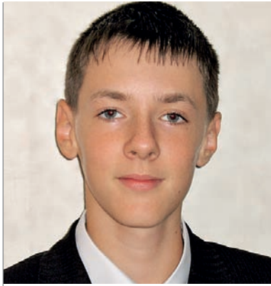
Игорь, 13 лет – Это Алла Борисовна Пугачева: она хорошо выдвинулась, о ней много говорили и у нее недавно был день рождения.

Мария, 10 лет – Наиболее значимой фигурой для меня является Медведев, потому что он президент и управляет нашей страной. Он решает, что предпринять в разных ситуациях вроде кризиса, посещает и принимает министров других стран, а также обсуждает с ними важные проблемы.